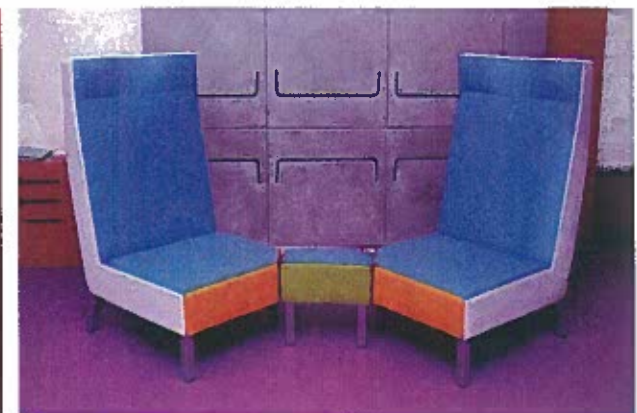
Deux éditions spéciales pour le Hi : le service de table Link, édité par la Manufacture de Monaco, et les fauteuils Interface de Modular.