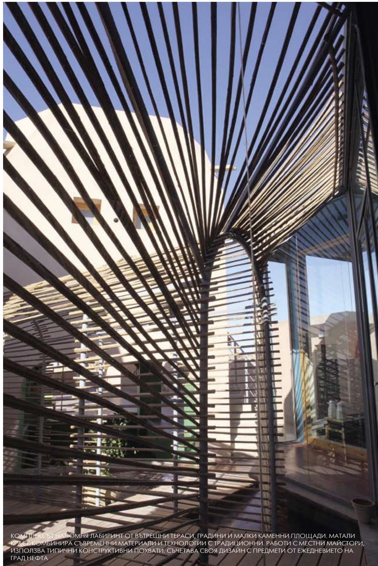
КОМПЛЕКСЪТ НАПОМНЯ ЛАБИРИНТ ОТ ВЪТРЕШНИ ТЕРАСИ, ГРАДИНИ И МАЛКИ КАМЕННИ ПЛОЩАДИ. МАТАЛИ КРАСЕ КОМБИНИРА СЪВРЕМЕННИ МАТЕРИАЛИ И ТЕХНОЛОГИИ С ТРАДИЦИОННИ РАБОТИ С МЕСТНИ МАЙСТОРИ, ИЗПОЛЗВА ТИПИЧНИ КОНСТРУКТИВНИ ПОХВАТИ. СЪЧЕТАВА СВОЯ ДИЗАЙН С ПРЕДМЕТИ ОТ ЕЖЕДНЕВИЕТО НА ГРАД НЕФТА