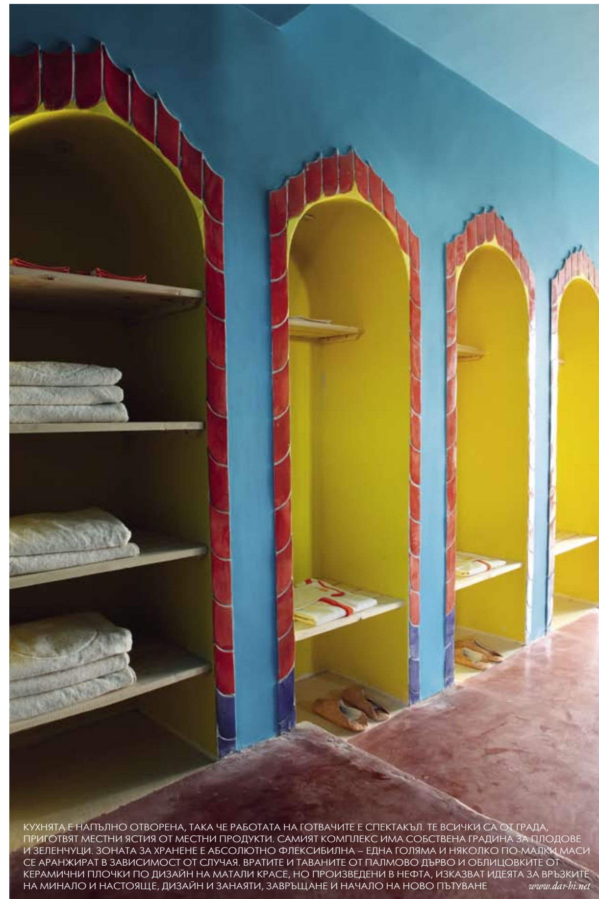
КУХНЯТА Е НАПЪЛНО ОТВОРЕНА, ТАКА ЧЕ РАБОТАТА НА ГОТВАЧИТЕ Е СПЕКТАКЪЛ. ТЕ ВСИЧКИ СА ОТ ГРАДА, ПРИГОТВЯТ МЕСТНИ ЯСТИЯ ОТ МЕСТНИ ПРОДУКТИ. САМИЯТ КОМПЛЕКС ИМА СОБСТВЕНА ГРАДИНА ЗА ПЛОДОВЕ И ЗЕЛЕНЧУЦИ. ЗОНАТА ЗА ХРАНЕНЕ Е АБСОЛЮТНО ФЛЕКСИБИЛНА – ЕДНА ГОЛЯМА И НЯКОЛКО ПО-МАЛКИ МАСИ СЕ АРАНЖИРАТ В ЗАВИСИМОСТ ОТ СЛУЧАЯ. ВРАТИТЕ И ТАВАНИТЕ ОТ ПАЛМОВО ДЪРВО И ОБЛИЦОВКИТЕ ОТ КЕРАМИЧНИ ПЛОЧКИ ПО ДИЗАЙН НА МАТАЛИ КРАСЕ, НО ПРОИЗВЕДЕНИ В НЕФТА, ИЗКАЗВАТ ИДЕЯТА ЗА ВРЪЗКИТЕ НА МИНАЛО И НАСТОЯЩЕ, ДИЗАЙН И ЗАНАЯТИ, ЗАВРЪЩАНЕ И НАЧАЛО НА НОВО ПЪТУВАНЕ www.dar-hi.net